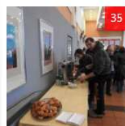
XXVII Światowy Dzień Chorego