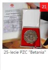
25-lecie PZC "Betania"