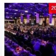
Wigilia dla ubogich i samotnych 24.12.2018