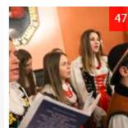
Opłatek u ks. Arcybiskupa